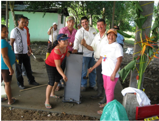
Compactando cemento fresco en el molde del filtro.

Este programa entrena a familias de áreas rurales y peri-rurales, que viven sin agua tratada, en la construcción de filtros de agua BioArena, practicas de higiene y técnica correcta para lavarse las manos. Más proyectos para otras regiones de Colombia están en camino.