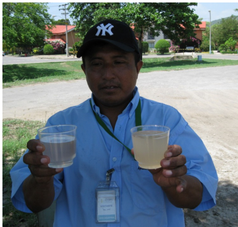
Observando la diferencia en la calidad del agua una vez que se logra el flujo correcto por el medio.